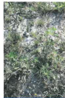
Situation juillet 2020 = plants d'ambrosie qui seront arrachés

Le bémol est de n'avoir eu que deux référents avec nous lors de cette rencontre ouverte au public !