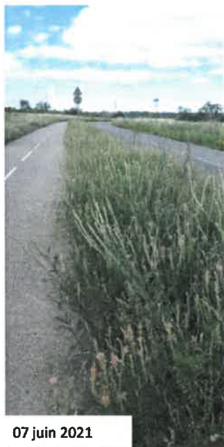
07 juin 2021