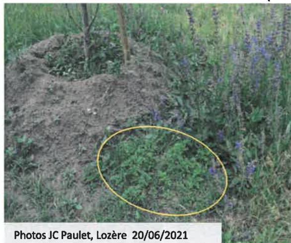
Lozère 20/06/2021

...Mais attention ! un remaniement du sol peut faire ressortir des ambroisies ! Témoin ce pré situé dans la vallée du