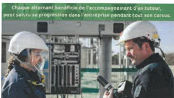
Chaque alternant bénéficie de l'accompagnement d'un tuteur, pour suivre sa progression dans l'entreprise pendant tout son cursus.

Directement sur le site internet d'Enedis !