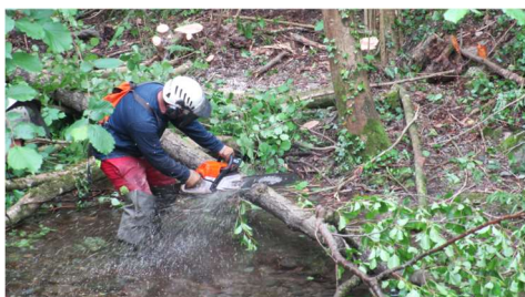
Travaux d'entretien de la rivière par l'équipe verte de l'EPTB Gardons : les végétaux susceptibles de faire obstacle à l'écoulement naturel du cours d'eau sont éliminés

passant par la Gardonnenque et les Gorges du Gardon qui accueillent le célèbre Pont du Gard. Il regroupe 161 communes (200 000 habitants) et compte plus de 3000 km de cours d'eau.