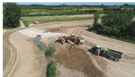
Travaux de suppression de digues défilantes et renaturation du Briançon à Théziers (ci-dessus) - Prélèvement réalisé dans le cadre d'une étude sur les eaux souterraines (ci-contre)